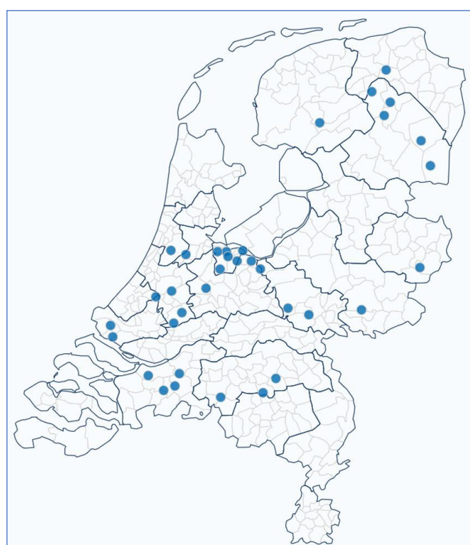
FIGUUR 2: DEELNAME AAN SNIV-INCIDENTIEMODULE DOOR VERPLEEGHUISLOCATIES IN NEDERLAND 2015-2019

Bron: RIVM, Referentiecijfers 2015-2019: Incidentiemodule verpleeghuizen SNIV, www.rivm.nl/sniv